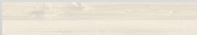
TSG-WAST/XF<ホワイトアッシュ>