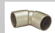
フレキシブルジョイント