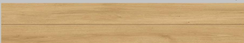
TSG-NOKT/XF<ナチュラルオーク>